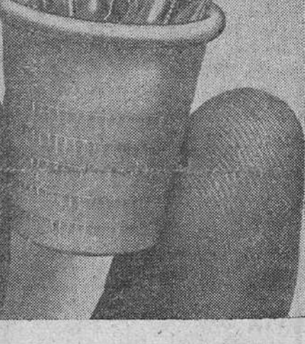
Las lámparas liliputienses