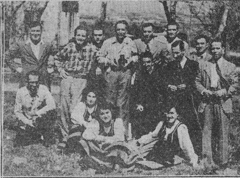
El grupo de danzas de la Sección Femenina ofreció, en la tarde del domingo, una audición, simpática en alto grado, a los enfermos del Sanatorio de Fuentes Blancas. Interpretó varias danzas para los acogidos, los cuales después, rodeando a varias de las muchachas allí desplazadas, posaron para DIARIO DE BURGOS — (Foto FEDE)