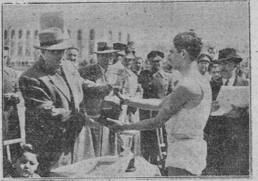
EL TENIENTE GENERAL YAGUE ENTREGANDO AL CAPITAN DEL EQUIPO DEL REGIMIENTO ARTILLERIA NUMERO 63 EL TROFEO DEL CAMPEONATO REGIONAL DE BALONCESTO DE LA SEXTA REGION MILITAR, QUE SE ADJUDICO EL DOMINGO.