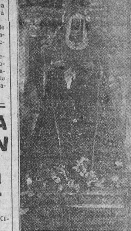
NUESTRA SEÑORA DE LA SOLEDAD CUYA IMAGEN RECORRERA PROCESIONALMENTE LAS CALLES DE LA CIUDAD, PARTIENDO DE LA IGLESIA DE SANTA AGUEDA.