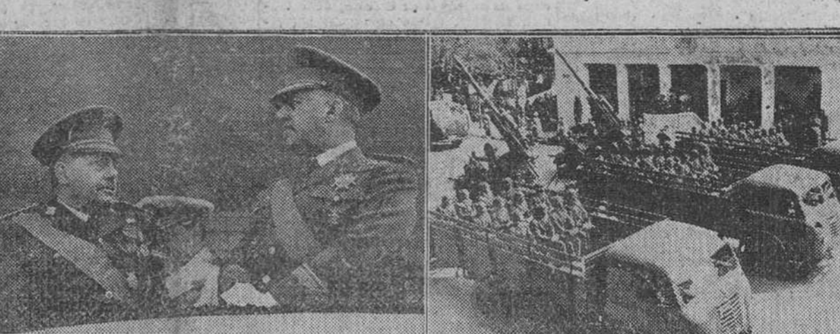
DOS MOMENTOS GRAFICOS DEL XII DESFILE DE LA VICTORIA CELEBRADO BRILLANTEMENTE EN MADRID EL SABADO. A LA IZQUIERDA S. E. EL JEFE DEL ESTADO ACOMPAÑADO DEL MINISTRO DEL EJERCITO, PRESENCIANDO DESDE LA TRIBUNA PRESIDENCIAL EL PASO DE LAS TROPAS. A LA DERECHA, LAS UNIDADES MOTORIZADAS DE ARTILLERIA ANTIAEREA, SOBRE CAMIONES «PEGASO», DESFILANDO ANTE EL CAUDILLO.