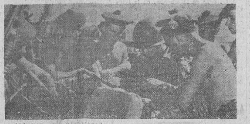
EN PEQUEÑOS CONTINGENTES VAN APARECIENDO SOBRE EL TEATRO BELICO DE COREA LOS PRIMEROS SOLDADOS BRITANICOS. SEGUN LAS ULTIMAS NOTICIAS, HASTA LA FECHA SOLO HA LLEGADO AL FRENTE UNA BRIGADA DE TROPAS DE GUARNICION EN HONGKONG...

Noticias de anoche informan que frente a la capital surcoreana fué cruzado el río Han