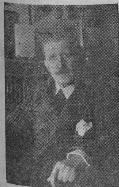
Una de las últimas fotografías de D. Joaquín Álvarez Quintero, gloria del Teatro español, fallecido en Madrid, el pasado miércoles

Londres.—Centenares de bombarderos Lancaster arrojaron una lluvia de proyectiles de mil toneladas sobre los cobertizos de cemento armado destruidos por los alemanes en El Havre