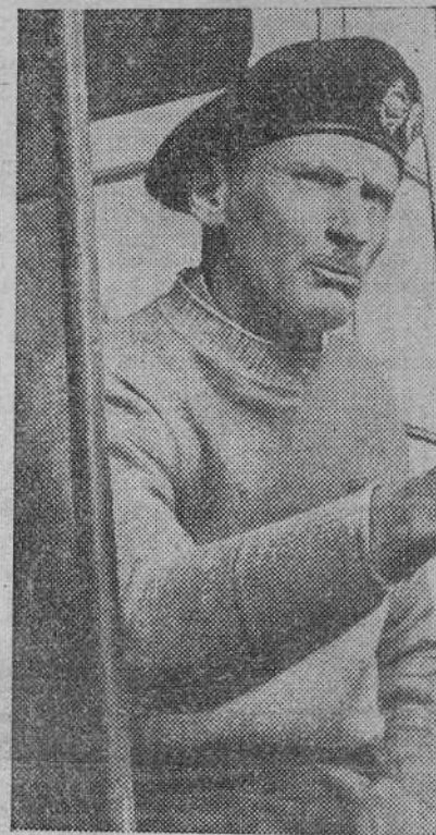
El general sir Bernard Montgomery, que actualmente manda las fuerzas terrestres aliadas que participan en la invasión

En el día de ayer se desarrollaron violentos combates en la región de Caumont y Tilly y al Suroeste de Balleroy. Fueron destruidos numerosos carros enemigos en estas luchas. El adversario sufrió pérdidas muy elevadas. Nuestras tropas mantuvieron sus posiciones en todos los sectores.