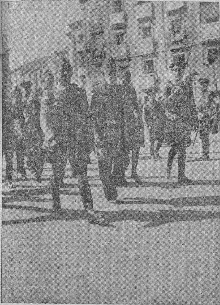
Su Excelencia el Generalísimo revistando a las fuerzas en la plaza de Alonso Martínez, el día de su exaltación al caudillaje de España

Hoy hace ocho años el "Boletín Oficial" publicaba en Burgos un decreto en el que se nombraba al general Franco Jefe del Estado Español y Generalísimo de las fuerzas nacionales de Tierra, Mar y Aire, confiriéndole el cargo de General Jefe de los Ejércitos de Operaciones. El Decreto señalaba en la parte expositiva no sólo la normalidad de la vida civil en todas las provincias rescatadas, sino también que estando establecido el enlace entre los varios frentes de los ejércitos que luchaban por la salvación de la Patria, se imponía ya un régimen orgánico y eficiente que respondiera a la nueva realidad española y preparar, con la máxima autoridad, su porvenir. Para ello era de alta conveniencia concentrar en un sólo poder todos aquellos que habían de conducir a la victoria final, al establecimiento, consolidación y desarrollo del nuevo Estado.