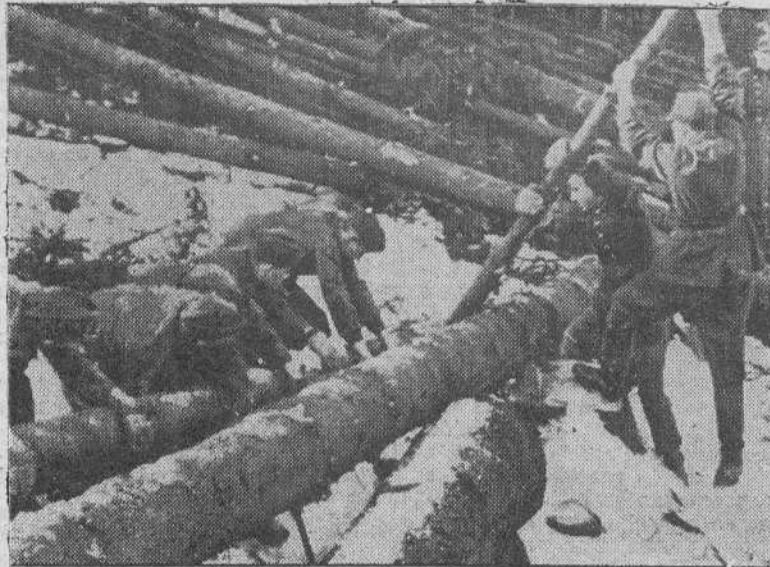
Un grupo de machachos del Servicio de Trabajo alemán, cococan los primeros troncos para la construcción de una fortificación de madera, en el frente Este.