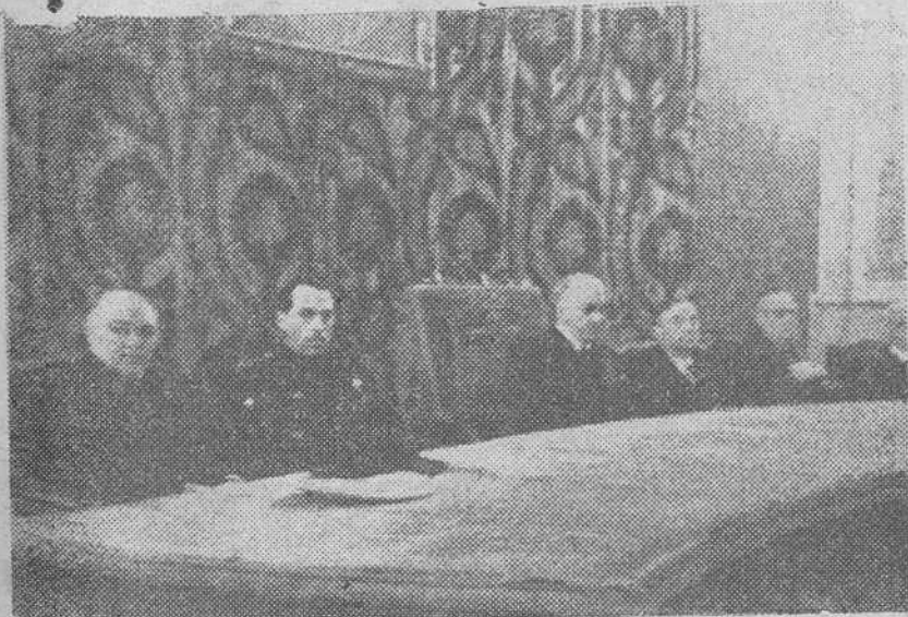
Madrid.—En la Universidad de Madrid se ha inaugurado el curso de la Facultad de Ciencias Económicas y Políticas.