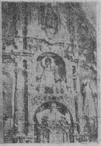
LA VIRGEN DE RIVAS