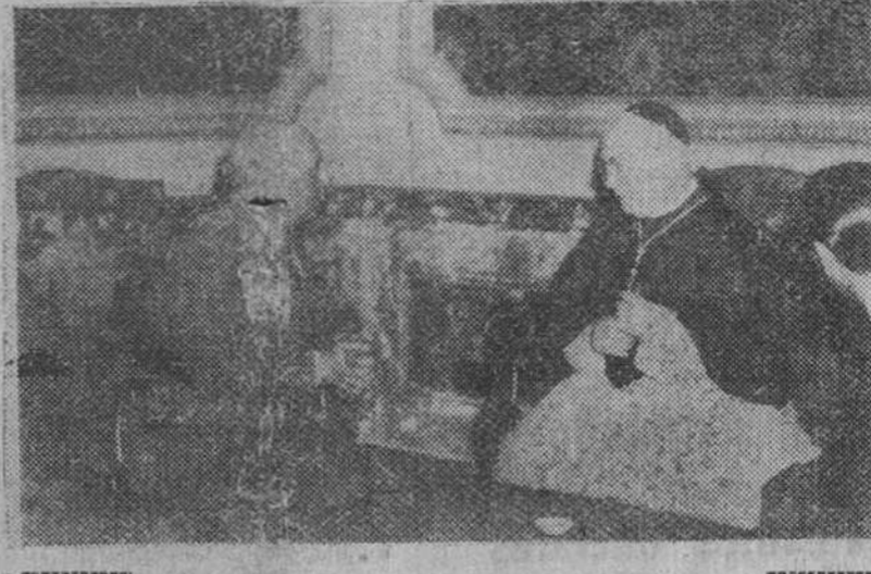
Barcelona.- El Cardenal-Arzbispo de Nueva York, monseñor Spellman, que asistió al Congreso Eucarístico internacional...