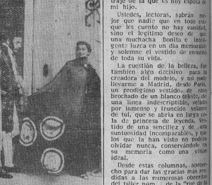
Paris. — Uno de los principales modistos de París ha presentado el "vestido ideal para la mujer-senador", en el curso de una sesión retrospectiva del "Senado a través de los tiempos". Un joven que personifica a los senadores de la época del Primer Imperio, admira la capa de "Madame Senador 1952", en la que destacan tres medallones con las efigies de Vicent Auril, Herriot y Monnerville.

El sol, bondadosamente, se ha puesto de su parte, y aparece entre los follajes de un verde suave, como un hábil escenarista que se dedica a iluminar lo más brillantemente posible los orgánicos eucarísticos y los tules de desposadas. Y París semeja un inmenso ramo de flores, en el que únicamente el color blanco tiene importancia.