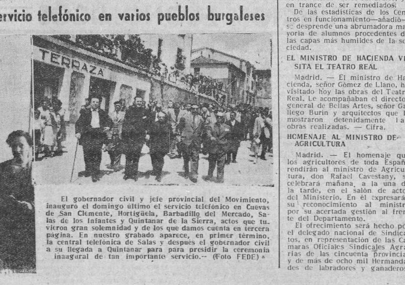
El gobernador civil y jefe provincial del Movimiento, inauguró el domingo último el servicio telefónico en Cuevas de San Clemente, Horticuela, Barbado del Mercado, Salas de los Infantes y Quintanar de la Sierra, actos que tuvieron gran solemnidad y de los que damos cuenta en tercera página. En nuestro grabado aparece, en primer término, la central telefónica de Salas y después el gobernador civil a su llegada a Quintanar para presidir la ceremonia inaugural de tan importante servicio.

EL PEOR TERREMOTO DESDE 1906 Los Angeles. — Se sabe que a consecuencia del terremoto, hay, por lo menos, diez muertos, todos en la pequeña ciudad desértica de Tehachapi. Seis personas murieron al hundirse el principal hotel de Tehachapi, de dos pisos. Los otros fallecieron al lanzarse aterrorizados a la calle y ser aplastados por los edificios que se derrumbaban.