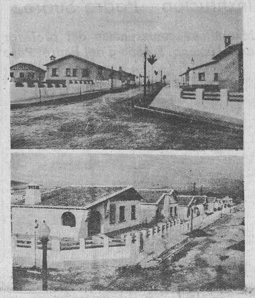
Perspectiva de una de las calles del poblado de F.E.F.A.S.A., que hoy será inaugurado solemnemente en Miranda de Ebro y un detalle de las nuevas viviendas.