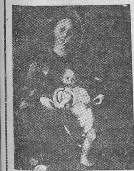
MODESTO CIRUELOS "LA VIRGEN Y EL NIÑO"

A pesar de que la mayoría de la obra de Ciruelos, como arte de hoy, tiende a la exclusiva y personal plástica con el problema que se impone como creador, llevando las cosas más allá de su límite humano, he aquí este lienzo con el cual enriquece su obra de tema sagrado, al que tradicionalmente consagraron su genio los mejores artistas.