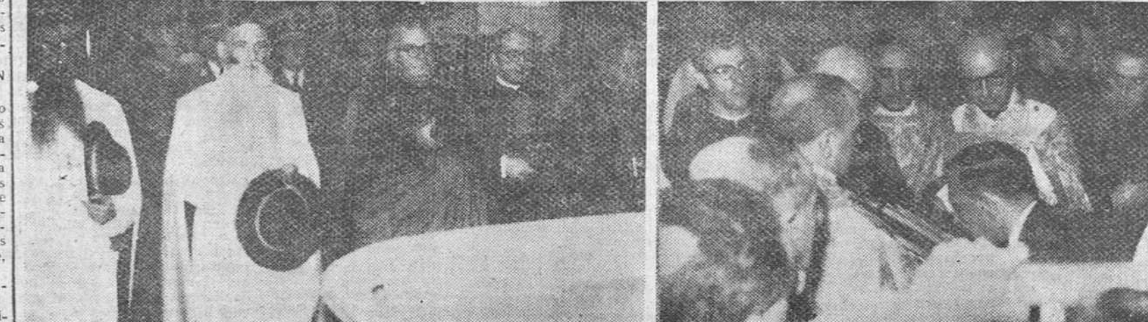
La ciudad tributó ayer un piadoso y triunfal recibimiento a la reliquia de San Francisco Javier, traída a Burgos en singular correspondencia a la hondaraigambre misionera de la Cabeza de Castilla. En la recepción de la santa reliquia tomaron parte autoridades y pueblo en general. A ella se refiere el presente grabado en el que aparecen, de izquierda a derecha, Prelados y autoridades burgalesas presidiendo el cortejo formado para conducir el brazo de San Francisco Javier a la S. I. C. B. M. y el presidente de la Diputación venerando la preciada reliquia.

CENSURAS AL CASAMIENTO DE EDEN. Londres. -- El diario anglicano "Church Times", en un severo editorial, censura el casamiento del secretario del Foreign Office, debido a que era divorciado. Señala que hace una generación, un ministro de Asuntos Exteriores se habría visto obligado a elegir entre su carrera política o un nuevo matrimonio una vez divorciado. Recuerda que el Duque de Windsor tuvo que renunciar al Trono hace sólo dieciséis años por querer casarse con una divorciada.