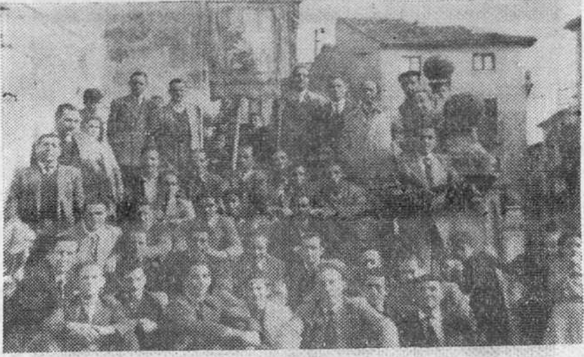
Concurrerotes al simpático acto de hermandad celebrado en Aranda, con motivo de la festividad de San Crispín, Patrono del ramo del cuero y de la piel