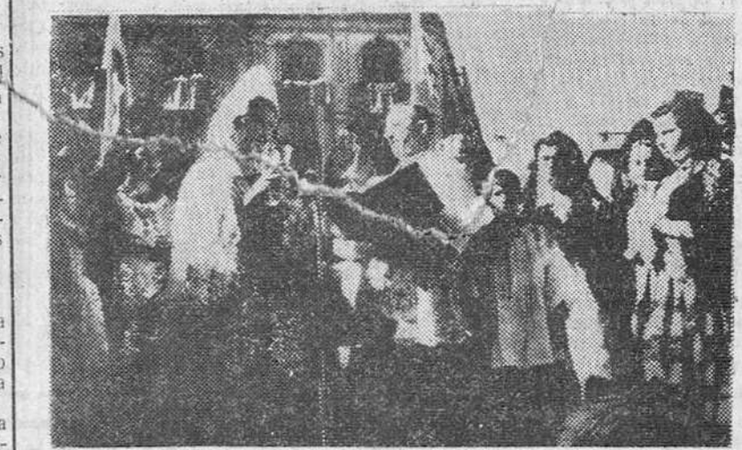
Valencia.— La Reina de la fiesta acompañada de sus damas de honor sostiene en su mano una copa de mosto que es bendecido por el sacerdote.

Valencia.— La Reina de la fiesta acompañada de sus damas de honor sostiene en su mano una copa de mosto que es bendecido por el sacerdote.