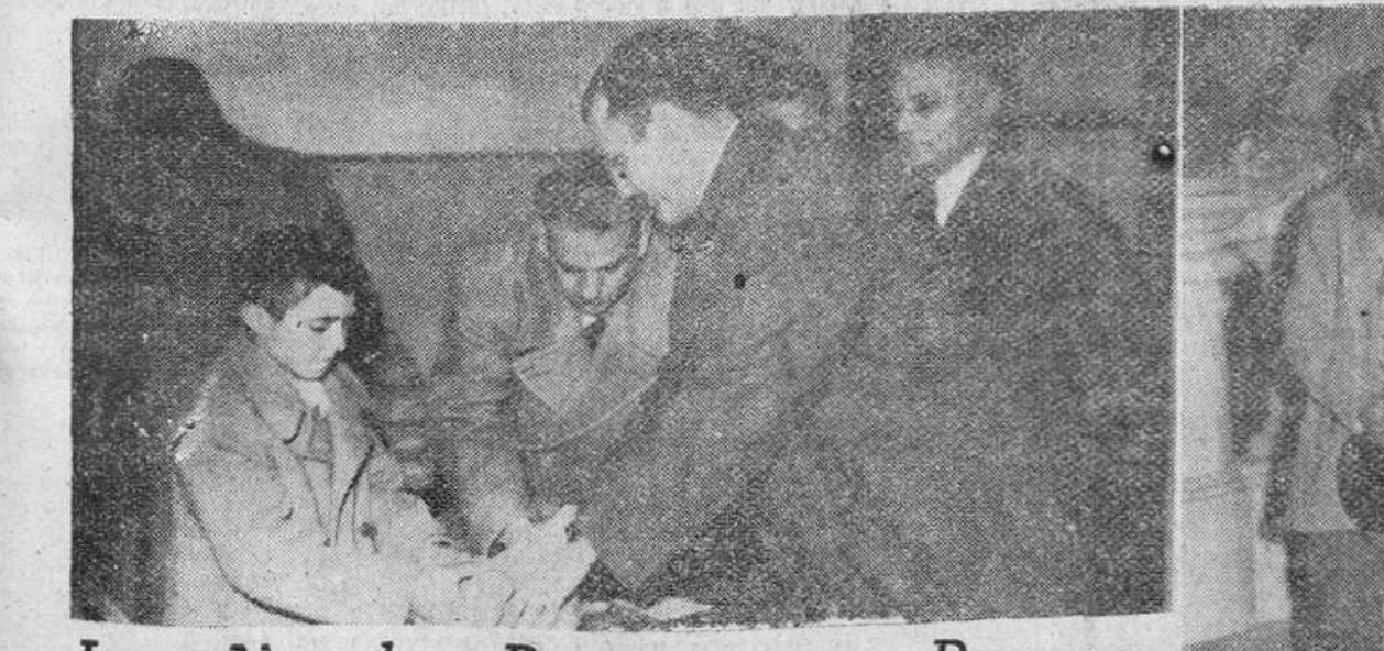
La «Noche Buena» en Burgos Dos documentos gráficos de la pasada «Noche Buena» en nuestra ciudad. A la izquierda, el Excmo. Sr. Gobernador civil y jefe provincial del Movimiento, señor Posada Cacho, entregando los aguinaldos a los niños de las escuelas de la barriada "Juan Yagüe". A la derecha, los pobres a quienes se dio una mesa, en la «Noche Buena», el Excmo. Sr. Arzobispo.

Saldrá de Inglaterra, por vía marítima, el próximo día de Nochevieja Muchas cábalas y comentarios Londres. — Winston Churchill saldrá en barco con rumbo a los Estados Unidos en la víspera de año nuevo, con objeto de visitar al presidente electo, Eisenhower, y al presidente saliente Truman, según se ha anunciado a primera hora de la madrugada de hoy sábado. El primer ministro británico realizará el viaje a bordo del trasatlántico "Queen Mary" y pasará unos quince días en la colonia británica de Jamaica, después de su breve visita a los Estados Unidos. La naturaleza particular de la visita de Churchill queda subrayada por el hecho de que ninguno de los principales ministros de su Gabinete le acompañará. Marcharán con él, únicamente, su esposa, su hija Mary y el esposo de ésta, Christopher Soames, miembro del Parlamento. En altas fuentes se ha dicho que no se cree que este viaje altere los planes de que se había hablado anteriormente, referentes a una visita oficial de Churchill a los Estados Unidos más entrado el año 1953. Esta visita no podría prepararse detalladamente hasta que Eisenhower asuma la presidencia, pero se cree que, en su iminente viaje, Churchill preparará muy probablemente lo relativo a su segunda visita, ya de carácter oficial, en la que le acompañará probablemente el secretario del Foreign Office.—Efe.