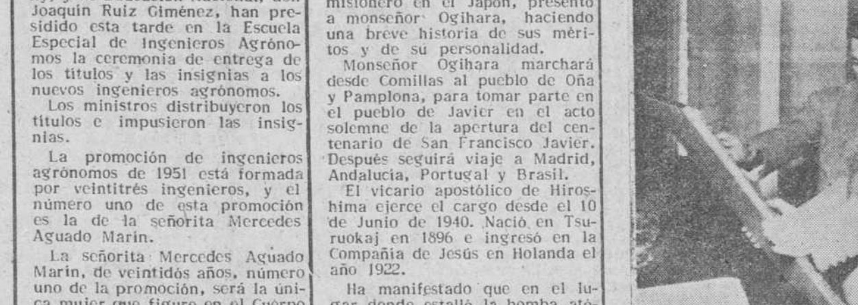
El Excmo. Sr. Gobernador civil y jefe provincial del Movimiento, examinando la artística placa que ayer le fue entregada por la organización sindical burguesa, con motivo del cariñoso homenaje de despedida que le fue tributado, en el Cine Córdón.