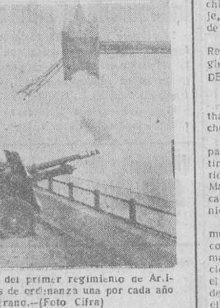
Londres.—Cañones de la Batería "A", del primer regimiento de Artillería, durante el disparo de las 56 salvas de ordenanza una por cada año que tenía el fallecido soberano.