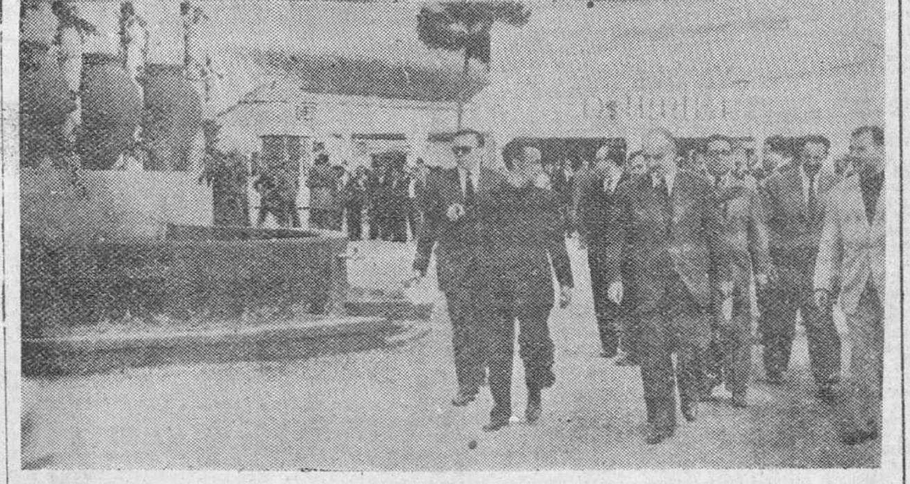
Valdepeñas. — El ministro de Agricultura, señor Cavestany, durante su visita al recinto de la X-Feria Regional del Vino de la Mancha, que clausuró después con un importante discurso.