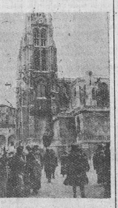
Nuestro reportero gráfico “Fede” sorprendió el domingo al Excmo. Ayuntamiento precedido por carneros y maceros a la salida de la Catedral, en donde asistió a una misa solemne con motivo de la festividad de Exaltación de la Santa Cruz.