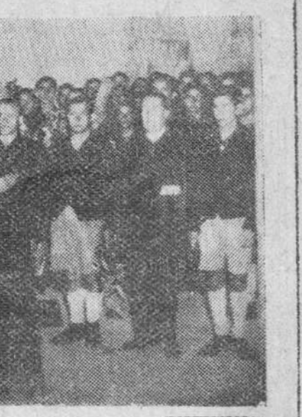
Homenaje del F. de Juventudes al Mariscal Carmona. Lisboa. — Los muchachos del Frente de Juventudes español que se encuentran estos días con sus dirigentes en Portugal, rindieron homenaje al Mariscal Carmona en la tumba de éste en el Monasterio de los Jerónimos.

Seul. — Los pilotos de la Armada dicen hoy que han dejado la ciudad nortecoreana de Noeriyong, en la frontera manchú, convertida en un montón de escombros, como resultado de la incursión de aviones Panther, de reacción, contra una fábrica de cemento, una instalación de carburo, otra de energía eléctrica y edificios de almacenaje.—Efe.