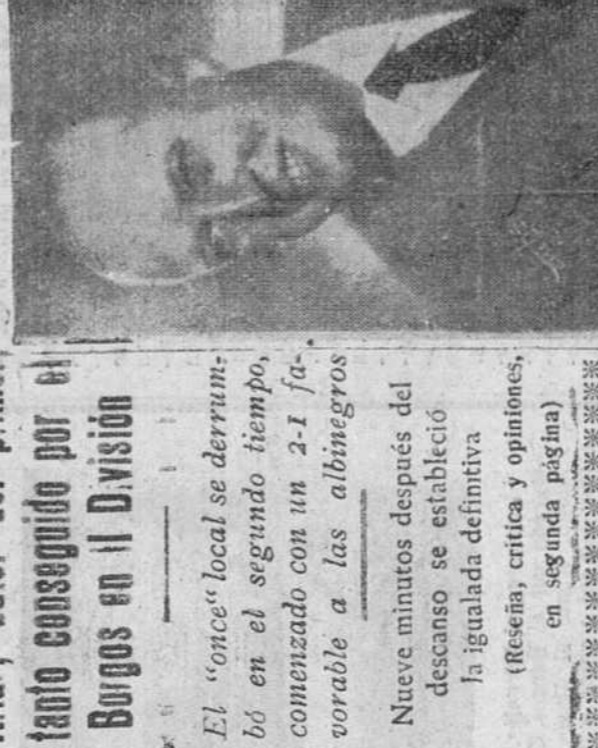
FIGURA DEL DIA

Preferimos subrayar, en vez de señalar, la figura del día. En el primer partido de Liga, que se celebró en el campo de fútbol de Zatorre, el equipo vitoriano inauguró el marcador de Zatorre a los cuatro minutos de juego. El partido terminó con un empate a uno.