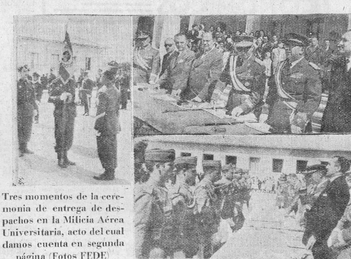
Tres momentos de la ceremonia de entrega de despachos en la Milicia Aérea Universitaria, acto del cual damos cuenta en segunda página