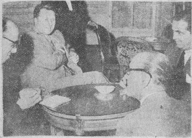
Henry Ford, en Madrid

Madrid.— El magnate de la industria del automóvil de los Estados Unidos Mr. Henry Ford, conversando con los periodistas en el hotel donde se hospeda, momentos después de su llegada a Madrid.