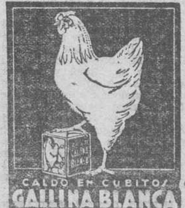
GAUDO EN CUBITO GALLINA BLANCA