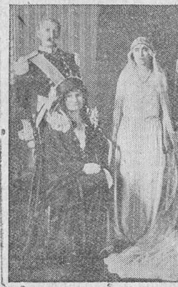
Arriba, S. A. R. la princesa heredera del Trono británico y madre taliz del nuevo vástago de la Real Familia inglesa. Abajo, grupo familiar del Rey Jorge VI, la Reina María, el hijo de ambos y actual Rey de Gran Bretaña, Jorge VI, el día de la boda de éste con Lady Elizabeth Bowes-Lyon, hija de los Condes de Strathmore y Kin. gherne, que aparecen a la izquierda de la fotografía.