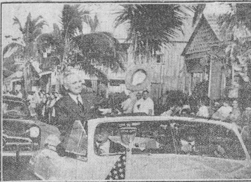
Florida.—Para descansar de las agotadoras jornadas electorales, una vez alcanzado el triunfo en las elecciones para la Presidencia, Truman se ha dirigido a Florida a pasar unas vacaciones. En la foto, aparece saludando desde el coche descubierto al numeroso público que presencia su paso por Key West (Florida).