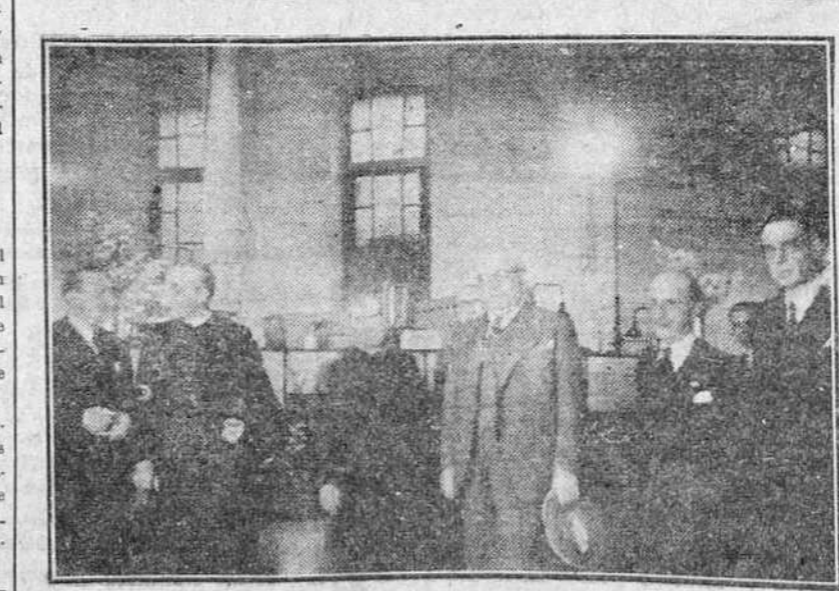
Las autoridades burgalesas en el acto de apertura de la Exposición de Trabajos Efectuados por los Alumnos de las Escuelas Técnico-Profesionales «Padre Arámburu», inaugurada ayer con motivo del fin del curso 1947-48.