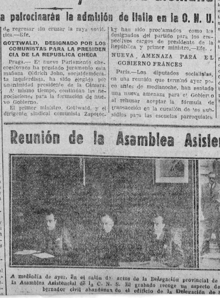
A mediodía de ayer, en el salón de actos de la Delegación provincial de Sindicatos, celebró sesión plenaria la Asamblea Asistencial de la C. N. S. El grabado recoge un aspecto de la presidencia del acto y al gobernador civil abandonando el edificio de la Delegación de Sindicatos.