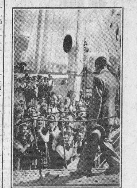
Vigo.—Las muchachas de los Coros y Danzas de España muestran su alegría al regreso de la Argentina, donde obtuvieron grandes triunfos. El embajador argentino, señor Radco, que acudió a recibir a las muchachas, es saludado cariñosamente.

Los coros y danzas de España regresan de la Argentina