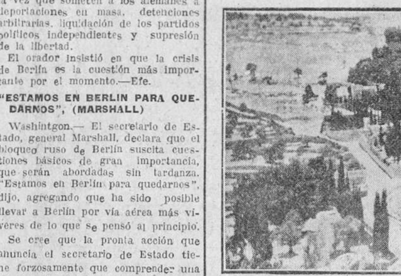
Gétemani, lugar donde se retiraba Jesús a orar con sus discípulos y donde después fue prendido por los judíos, hoy escenario de luchas sangrientas.—(Foto CIFRA)

Esta cruzada sigue sin resolverse conforme a los derechos de la Iglesia, después de ocho siglos de disputa