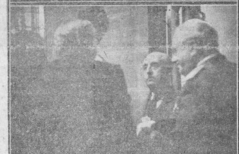
REPORTAJE GRÁFICO TOMADO A LA LLEGADA DEL CAUDILLO... SU EXCELENCIA EL JEFE DEL ESTADO, DESPUES DEL CLAMOROSO RE-