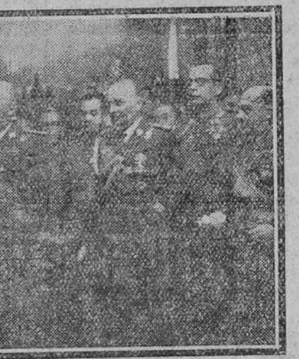
EL MINISTRO DEL EJERCITO Y LOS ALTOS JEFES MILITARES DE LA GUARNICION DE MADRID COMPLIMENTAN A S. E. EL JEFE DEL ESTADO CON MOTIVO DE LA PASCUA MILITAR, EN SU RESIDENCIA DEL PALACIO DE EL PARDO.