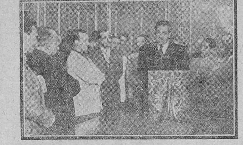
LAS ORGANIZACIONES SINDICALES ENTREGAN UNA PLACA DE PLATA AL MINISTRO DE TRABAJO, EN TESTIMONIO DE GRATITUD POR SU FEUNDA LABOR SOCIAL.