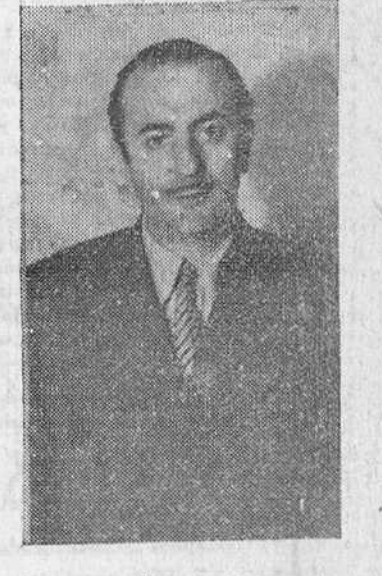
(Continúa en última página)

“Una continuación solicitó la colaboración de todos para que le ilustrasen con sus consejos y sugerencias y refirieron