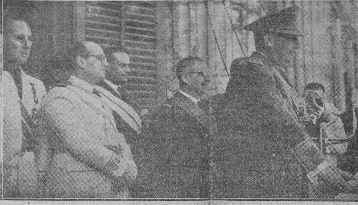
Presentamos un reportaje gráfico de la patriótica jornada del "Día de la Victoria" en Madrid. A la izquierda, el Caudillo presenciando el desfile de las tropas. A la derecha S. E. correspondiendo a las aclamaciones de la multitud, desde el palacio de Oriente. Al pie, la muchedumbre congregada en dicha plaza, aclama al Jefe del Estado.