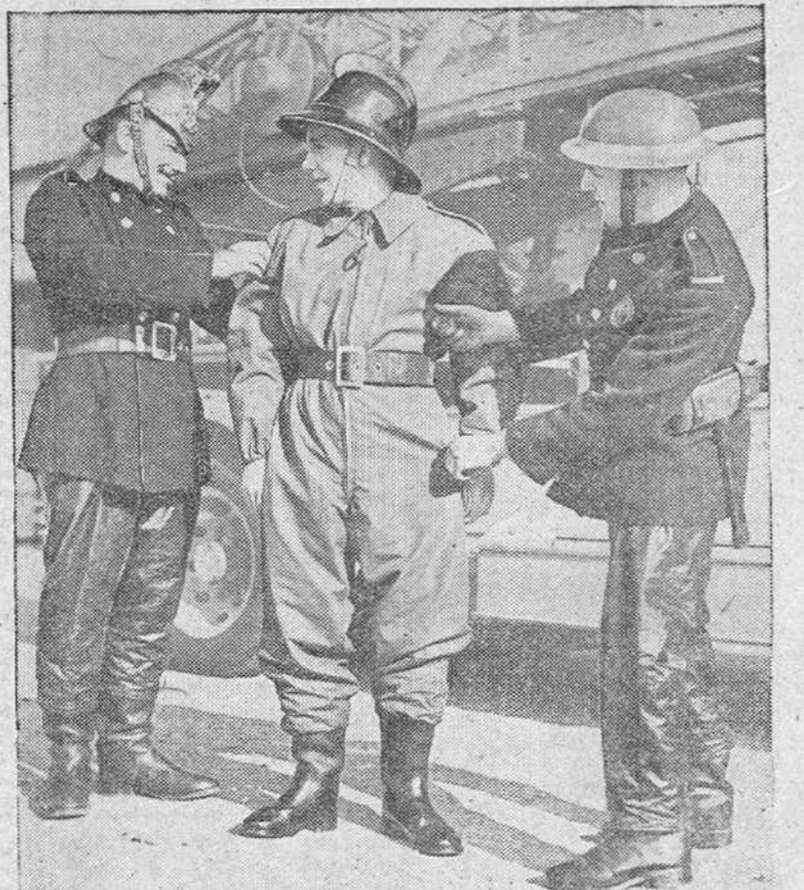
ESTOS BOMBEROS LONDINENSES PRUEBAN A UN COMPAÑERO EL NUEVO TRAJE IMPERMEABLE CON QUE ESTAN SIENDO EQUIPADOS TODOS LOS MIEMBROS DE LOS SERVICIOS DE INCENDIOS DE GRAN BRETAÑA. ESTA CONSTRUIDO CON MATERIALES ESPECIALES INCOMBUSTIBLES Y PROTEGE EFICAZMENTE EL CUERPO AUN EN LOS MAS VIOLENTOS SINIESTROS.