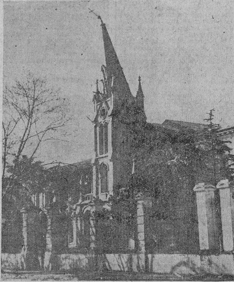
Esta es la torre de la iglesia que en Concepción tienen las Madres Sacramentinas. El edificio tendrá que ser dinamitado, lo mismo que muchos otros de la ciudad, con el fin de impedir su hundimiento total en momento más peligroso para el bien común.

El terremoto sobrevino cuando la ciudad se preparaba para festejar el aniversario de la batalla de Iquiche