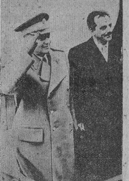
Churchill prestó su apoyo a Tito en su lucha contra los alemanes. El Premier inglés acariciaba el proyecto de abrir un nuevo frente en los Balcanes con la ayuda de los guerrilleros comunistas que combatían a los órdenes del cabecilla yugoslavo

Hermoso ejemplo de maquillaje político británico: apoyar a los comunistas en el plan militar reservándose, mientras tanto, para el porvenir, una oportunidad política en beneficio de Pedro II.