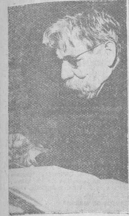
El Dr. Albert Schweitzer, de 78 años de edad, que desde hace 48 sacrificó una brillante carrera como filósofo, científico, teólogo y misionero...