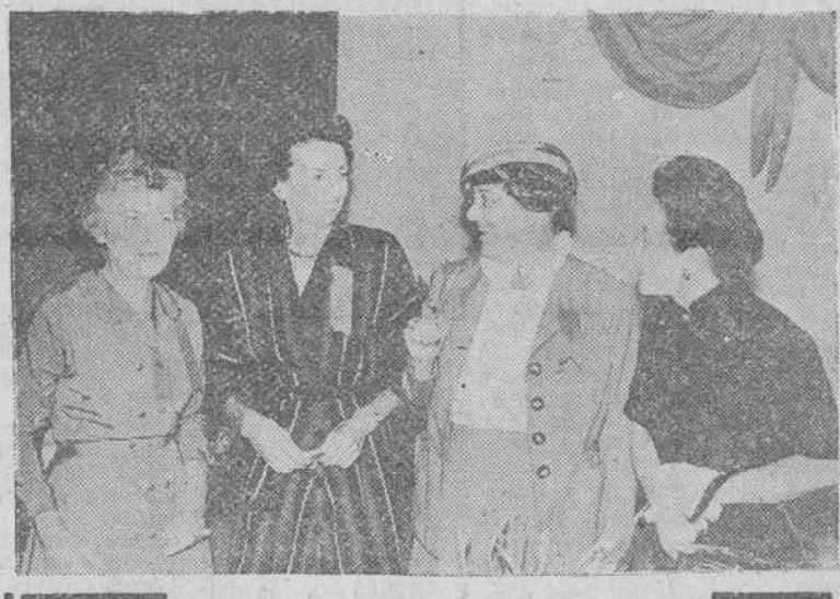
Taipeh. — La esposa del generalísimo chino, a la derecha, con la del embajador de los Estados Unidos en Taipeh y otras ilustres damas, en la visita que realizaron al hospital donde se encuentran los soldados nacionalistas heridos.