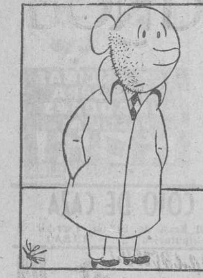
Es que me afeitó con la máquina eléctrica que tú me regalaste y apagaron la luz de repente.