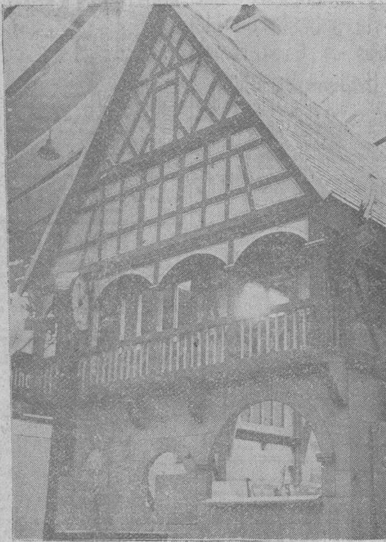
Esta casita está hecha toda de cartón ondulado y constituye una de las obras maestras, que se exhiben en el "Salón de embalaje", situado en la Puerta de Versailles, de París.