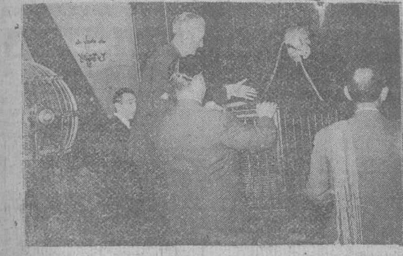
Madrid. — En el salón de sorteos de la Lotería Nacional, se ha celebrado la adjudicación de automóviles que el Ministerio de Comercio, realiza periódicamente entre los solicitantes de automóviles de importación. El sorteo fue presidido por un notario, y la fotografía nos muestra a los empleados de la sala, realizando las operaciones preliminares. (Foto Cifra).