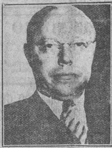
Nueva York. — El senador Taft ha fallecido, víctima de un cáncer.

El ilustre político mantuvo siempre una actitud amistosa y comprensiva para España