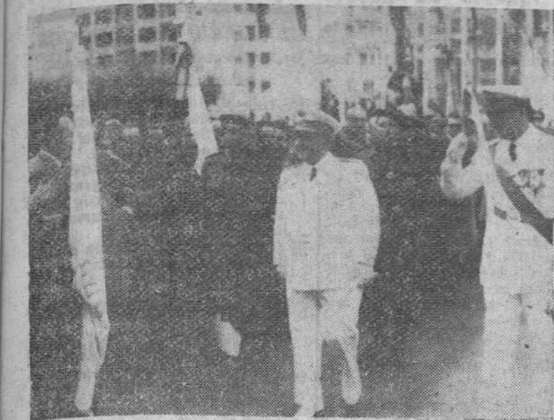
San Sebastián. — Su Excelencia el Jefe del Estado, acompañado del gobernador civil de la provincia, saludada a las autoridades que acudieron a recibirle a su llegada a la capital donostiarra.