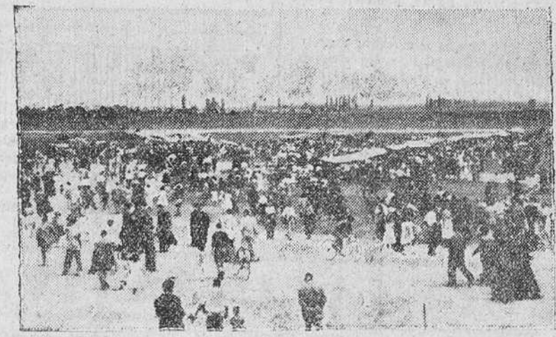
El festival aéreo de Vitoria. Una vez terminado el festival aéreo en honor del ingeniero señor Fournier, precursor de la Aviación española, el público se lanzó a la pista de aterrizaje para curiosar los aparatos que participaron en dicho festival.