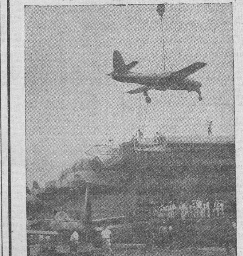
En un puerto norteamericano son embarcados un centenar de aviones de propulsión a chorro, como uno de los lotes destinados a las tropas nacionalistas chinas en Formosa.