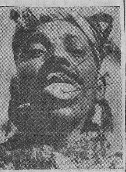
Una de las más curiosas costumbres de los Ayssaonas, tribu religiosa del Sur de Argelia, consiste en arrojarse de parte a parte la lengua y mejillas, con largas agujas, como nos muestra esta fotografía.