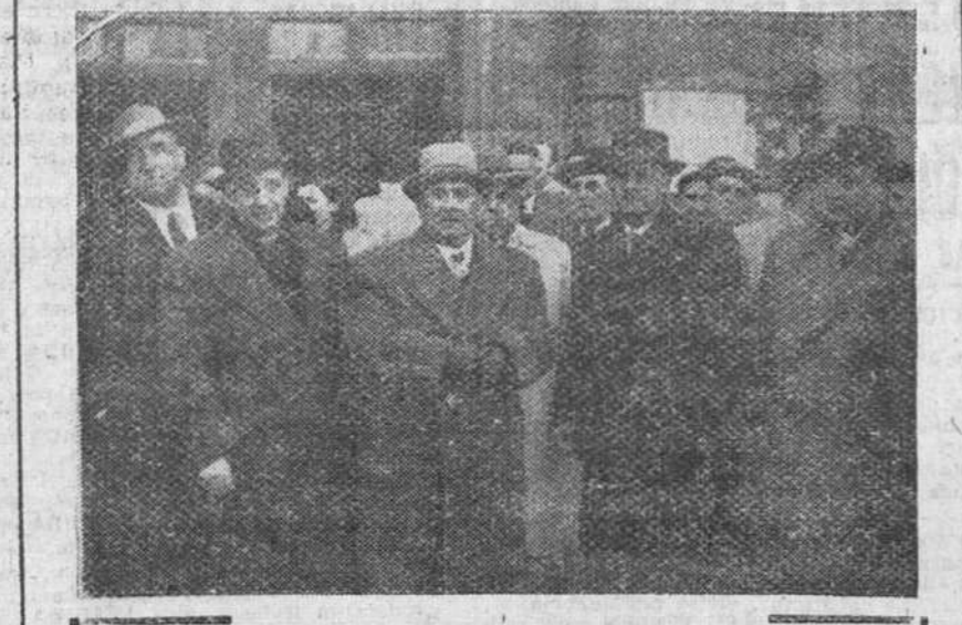
Fiesta del Casino de Funcionarios. El presidente del Casino Recreativo Cultural de Funcionarios y las autoridades que asistieron a la Misa celebrada en la mañana del domingo, con motivo de la fiesta del Santo Ángel de la Guardia, Patrono de la veterinaria Sociedad burgalesa.