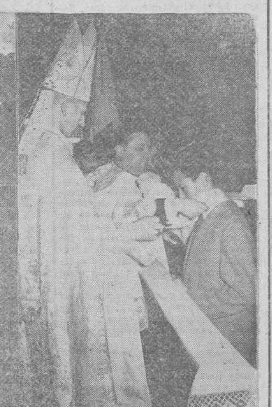
Cinco documentos gráficos de los actos celebrados ayer en Burgos en conmemoración de la fiesta de la Inmaculada Concepción. De arriba abajo y de izquierda a derecha: las fuerzas del Regimiento de Infantería San Marcial, desfilando ante las autoridades, después de asistir a la misa celebrada en la iglesia de la Merced, en honor de su Patrona; un grupo de letrados burgaleses, que también honraron a su Patrona en la iglesia del Carmen; el abad mirrado de Cardena, imponiendo las Medallas de congregantes marianos a varios alumnos del Colegio "La Salle"; la brigada de camilleros de la Cruz Roja, que formó ayer para asistir a la fiesta conmemorativa de su Patrona y, por último, el Excmo. y Rvdmo. Sr. Arzobispo durante la bendición de las instalaciones del Consejo Diocesano de los Jóvenes de Acción Católica.