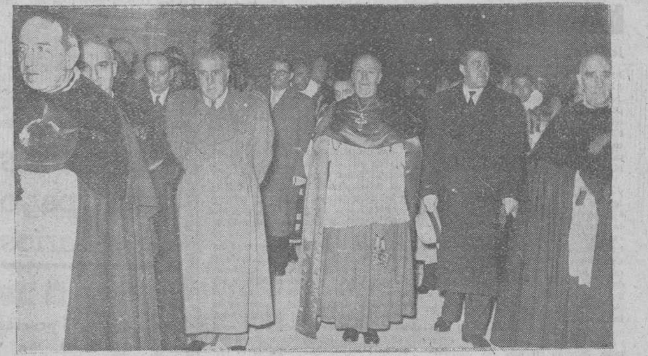
El Excmo. Sr. Arzobispo, acompañado del Cabildo Metropolitano, capitán general de la Sexta Región, gobernador civil y jefe provincial del Movimiento, Corporaciones provinciales y municipales en pleno y resto de autoridades burgalesas, hace su entrada en nuestro S. T. Metropolitano, para presidir la solemne ceremonia de apertura del Año Mariano, en Burgos.

Presidió la gigantesca solemnidad mariana el Excmo. Sr. Arzobispo, acompañado por todas las autoridades burgalesas