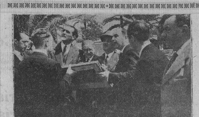
Sevilla. - S. E. el Jefe del Estado, acompañado del ministro de Educación Nacional y de otras destacadas personalidades, examina los planos de las obras que se llevan a cabo en el antiguo edificio de la Real Fábrica de Tabacos...