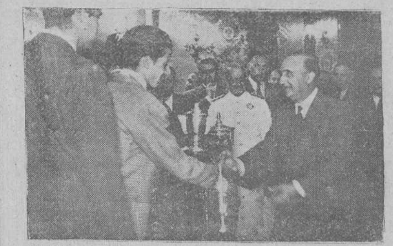
La Coruña.—Su Excelencia el Jefe del Estado, haciendo entrega de los premios a las tripulaciones vencedoras en las regatas de traineras y balandros celebradas en esta bahía y que fueron presenciadas por el Caudillo desde el Club Náutico