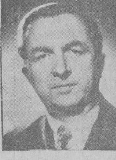
Giuseppe Pella, jefe del Gobierno italiano, que ha propuesto un plebiscito para la solución del problema de Trieste.