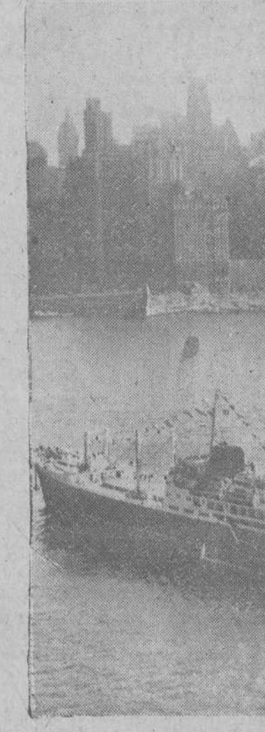
Nueva York.—Teniendo como fondo los rascacielos, la nueva motonave española "Covadonga" nos ofrece esta bella fotografía, a su llegada al puerto de Nueva York, al término de su primer viaje trasatlántico, desde Bilbao.