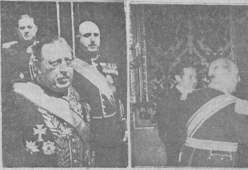
En el Palacio de Oriente presentaron sus credenciales, el lunes último, los nuevos embajadores de Grecia y Venezuela, que aparecen en nuestros grabados, el primero, al dirigirse a Palacio y el segundo, a la izquierda del Caudillo, mientras éste saluda al personal de la Embajada.