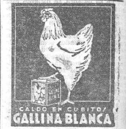
CALDO EN CUBITO GALLINA BLANCA