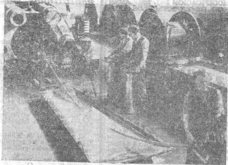
El cable es revestido de una capa especial para que adquiera mayor resistencia contra los elementos corrosivos del agua del mar.

Brotó entonces el deseo de comunicar telegráficamente Europa con América. Pero costó llevarse a la práctica, casi doce años, cuando ya era necesidad. Mucho trabajo hubo de realizarse y las dificultades