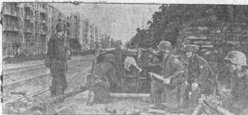
Calle a calle la ciudad de Vorochilovsk, fué conquistada por los alemanes que obtuvieron entonces la llave absoluta del Don. En la foto un momento de la lucha