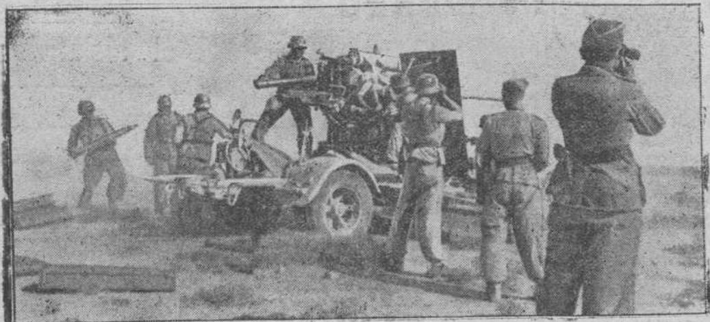
Artillería antiaérea alemana haciendo fuego raso contra unidades mecanizadas enemigas que realizan un ataque, en frente de Sollum