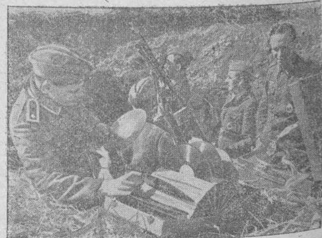
Estos soldados alemanes, sin dejar de vigilar los intentos enemigos, dedican un intervalo de tiempo a la música de un sencillo gramófono. La ametralladora MG no deja de ofrecer un original contraste con la caja de música y sus discos

LOS ESTUDIANTES italianos en la guerra Roma.— Mil trescientos estudiantes y siete estudiantes fascistas han contratado la muerte en el curso de tres años de guerra, dice la Asociación Stefani, que añade: Otros 1.200 recibieron diversas condecoraciones militares de oro.— Efe.