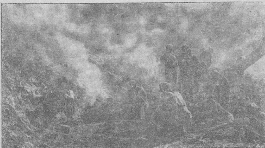
El importante paso estratégico de Kulchor, en el Cáucaso, ha sido dominado por los alemanes después de violenta lucha. Aquí les vemos cocinando ellos mismos su comida, después de la dura jornada.