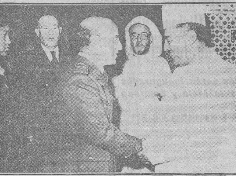
Tetuán. — El Alto-Comisario de España en Marruecos, teniente general García Valiño, felicita a S. A. I. el Jalifa, con motivo del XXIX aniversario de su exaltación al trono de la Zona Jaliñana, en la recepción celebrada en el palacio imperial.