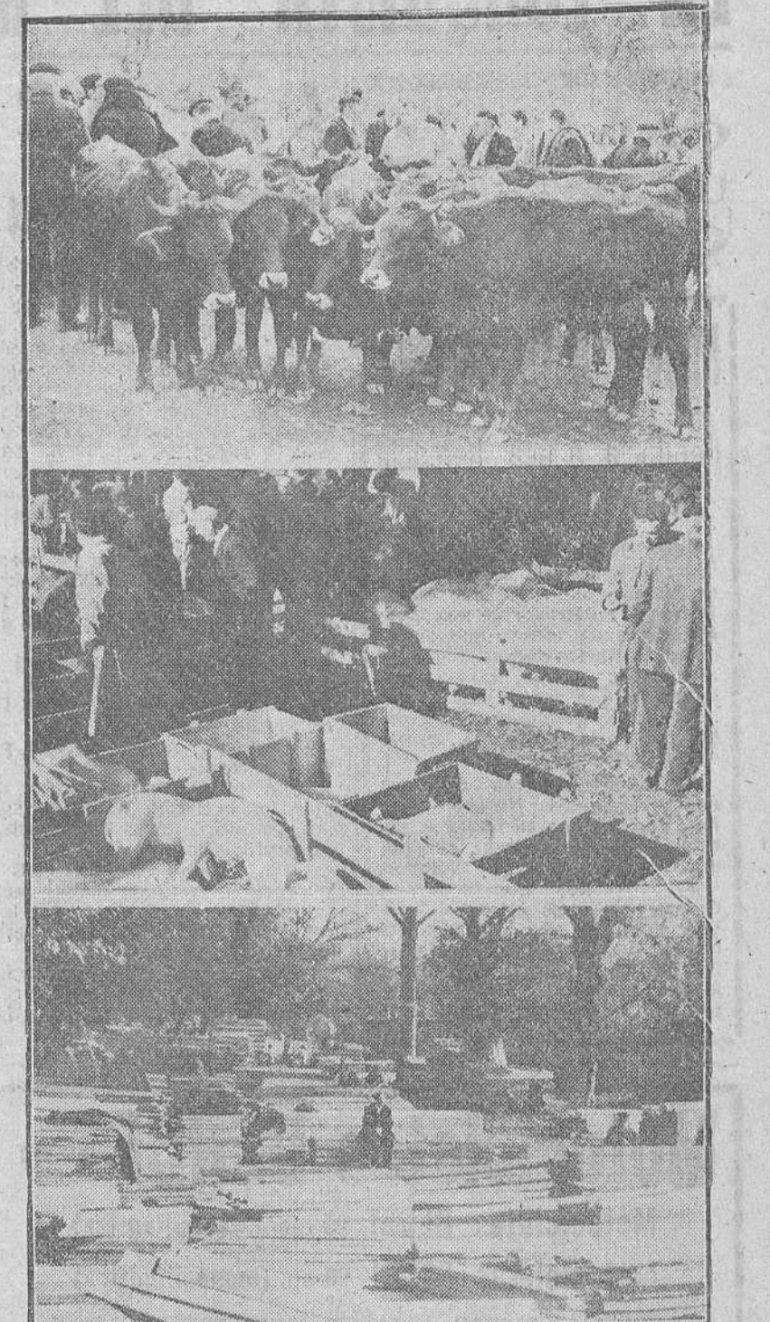
Otras tres estampas del primer día de la feria de San Martín. Un grupo de "jatos" serranos, una vista del mercado porcino y un aspecto del mercado de maderas.