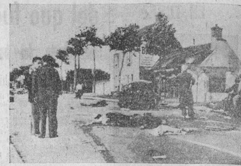
Paris. — Entre Trappes y Rambouillet se produjo un trágico accidente de la circulación. Un pequeño turismo ocupado por un matrimonio escandinavo, se despidió entrando en colisión con un camión, resultando literalmente triturado. Sus ocupantes fueron proyectados sobre la carretera, muriendo en el acto. — (F. Gil del Espinar)