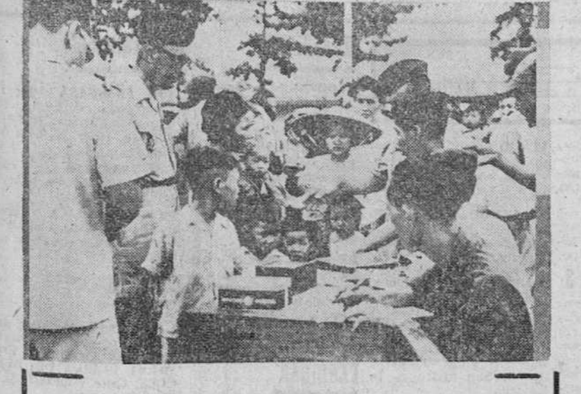
Abandonando las aldeas del Norte de Vietnam, que en virtud de los acuerdos de Ginebra quedarán en poder de los comunistas, millares de refugiados afluyen al puerto de Haiphong para ser evacuados hacia el Sur. Militares franceses clasifican a los refugiados en el puerto.