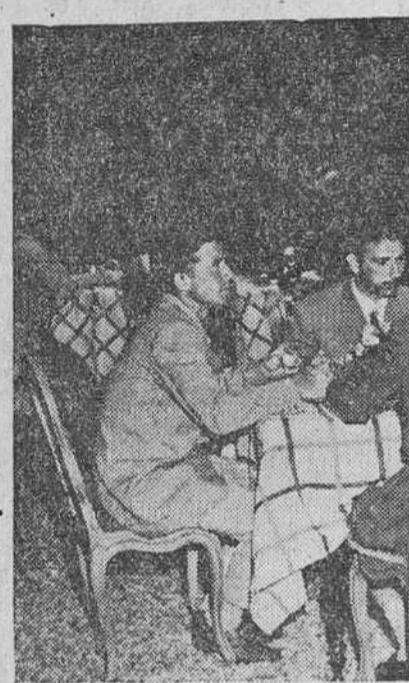
París.—El embajador de España en París, conde de Casas Rojas, con los componentes del equipo español en la Vuelta a Francia, en la comida que les ofreció en los jardines de la Embajada, por su actuación en el tour.