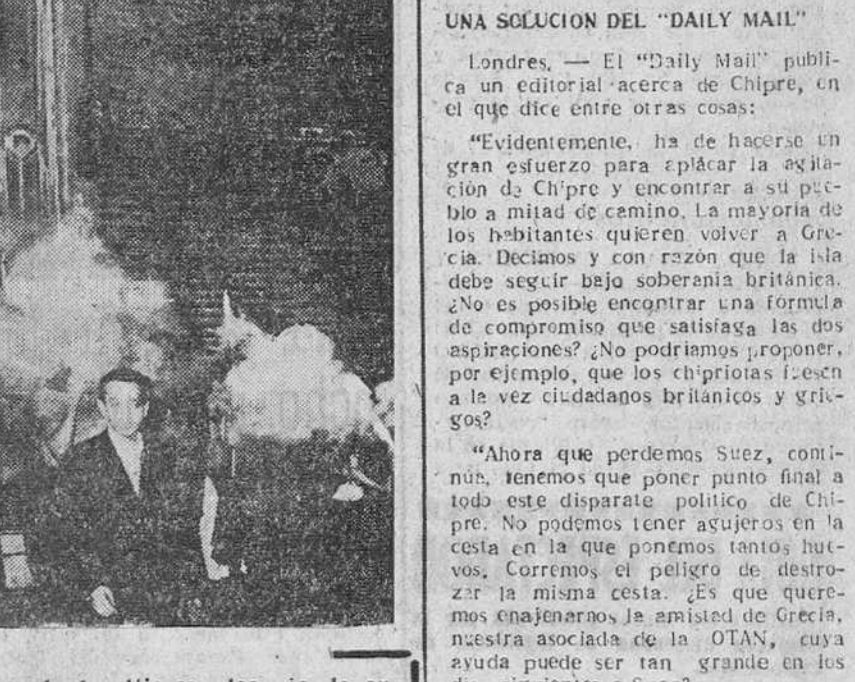
Granada.—La imagen de la Virgen de las Nieves, después de su bendición, sale del templo en procesión al pico del Veleta, donde se había de celebrar la tradicional misa en su honor, a la que asistieron cerca de cuatro mil personas, a pesar de las dificultades de la ascensión, entre ellas un número elevado de mujeres.