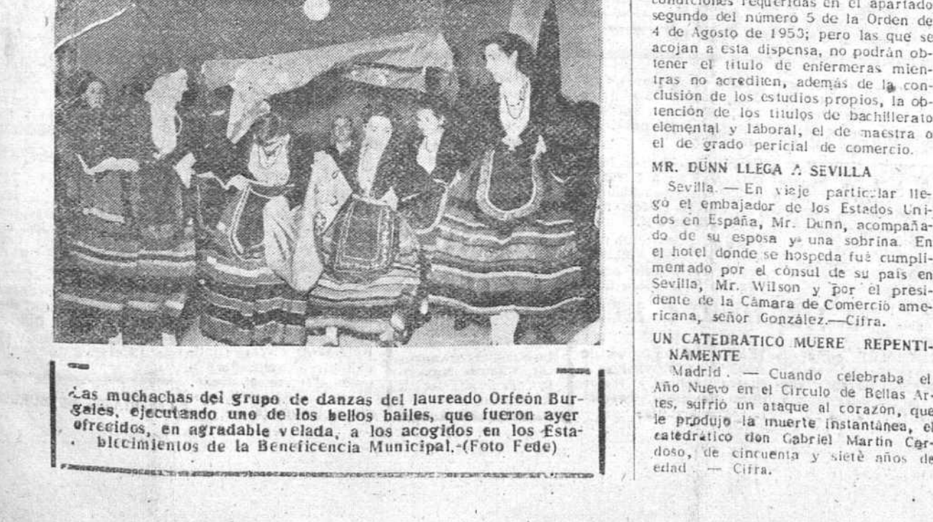
Las muchachas del grupo de danzas del jaureado Orfeón Buralés, efectuando uno de los bellos bailes, que fueron ayer ofrecidos, en agradable velada, a los acogidos en los Establecimientos de la Beneficencia Municipal.