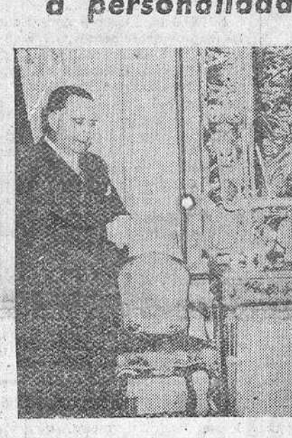
Lisboa.—El ministro de Negocios Extranjeros de Portugal, profesor Pablo Cunha, pronunciando unas palabras de gratitud, ante el embajador español, don Nicolás Franco, con motivo de la entrega e imposición de condecoraciones españolas a diversas personalidades portuguesas, acto celebrado en la Embajada de España.